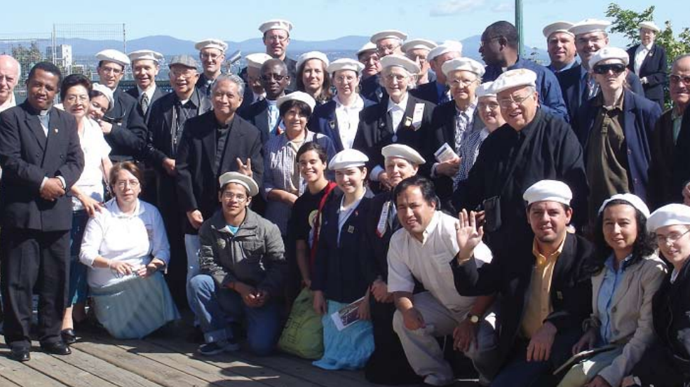
Un groupe de Pèlerins de saint Michel en pèlerinage à Québec.

En plus de milliers d'apôtres locaux «à temps partiel» qui donnent leurs temps libres, après leur gagne-pain, pour faire connaître Vers Demain et visiter les familles, il existe une cinquantaine d'apôtres «à plein temps» qui donnent tout leur temps, soit au bureau de Vers Demain ou sur la route dans les différentes régions du Canada et des autres pays. Tout est fait bénévolement, et personne ne reçoit de salaire, pas même ceux qui impriment les circulaires.