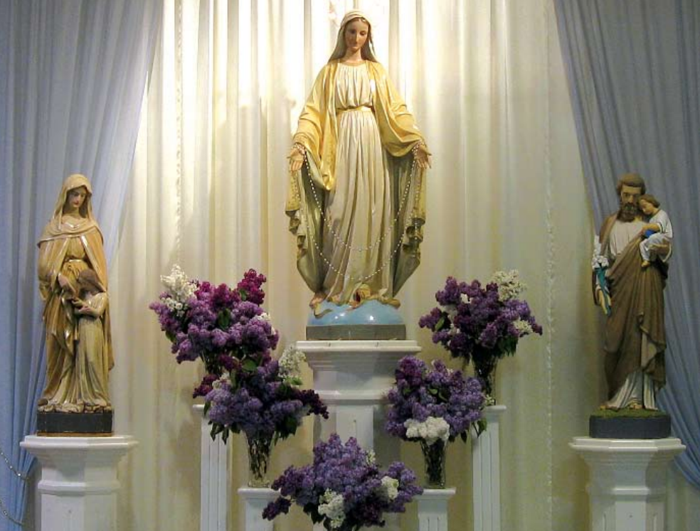
Statues de sainte Anne, de la Vierge Marie, et de saint Joseph, dans la Maison de l'Immaculée.

C'est pour cette raison que Louis Even décida de propager la doctrine du Crédit Social — un ensemble de principes et de propositions financières énoncés pour la première fois par l'ingénieur écossais Clifford Hugh Douglas, en 1918 (les mots «Crédit Social» signifient «argent social» — un argent émis par la société, en opposition à l'argent actuel qui est un «crédit bancaire» — un argent émis par les banques).