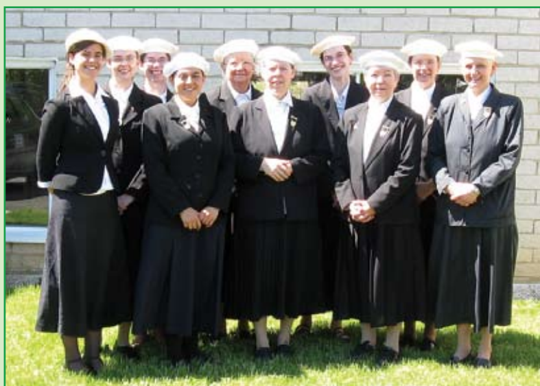
Un groupe de Pèlerines à plein temps à Rougemont.

En plus de milliers d'apôtres locaux «à temps partiel» qui donnent leurs temps libres, après leur gagne-pain, pour faire connaître Vers Demain et visiter les familles, il existe une cinquantaine d'apôtres «à plein temps» qui donnent tout leur temps, soit au bureau de Vers Demain ou sur la route dans les différentes régions du Canada et des autres pays. Tout est fait bénévolement, et personne ne reçoit de salaire, pas même ceux qui impriment les circulaires.