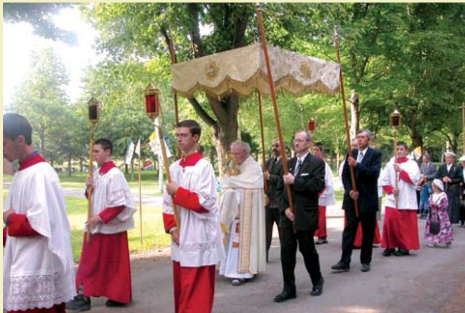
Procession de la Fête-Dieu sur nos terrains à Rougemont. Bénédiction du Saint Sacrement par un évêque du Congo.