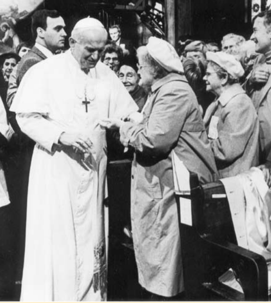
Le Pape Jean-Paul II s'adressant à deux Pèlerines de saint Michel au sanctuaire des Martyrs canadiens à Midland, en Ontario, lors de sa visite au Canada en 1984.

Les Pèlerins de saint Michel ont aussi leur propre imprimerie où ils impriment des millions de circulaires gratuites, financées grâce aux dons de bienfaiteurs. L'expansion de leur mouvement est tout simplement phénoménale: depuis plus de cinq ans, par exemple, ils réussissent à imprimer et distribuer à travers le monde chaque année l'équivalent de 30 millions de circulaires de quatre pages, dans plus de huit langues.