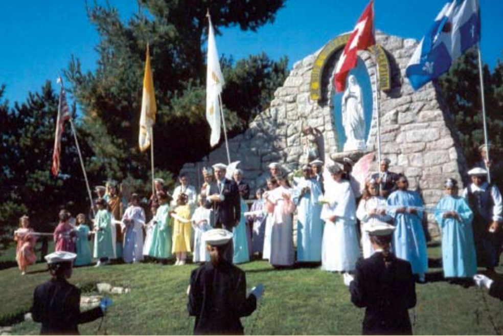
Procession du chapelet devant la grotte de Notre-Dame de Lourdes sur nos terrains à Rougemont.

Si les Pèlerins de saint Michel parlent beaucoup dans leurs publications de questions monétaires et économiques, c'est parce que, comme le disait le Pape Benoît XV, «c'est sur le terrain économique que le salut des âmes est en danger».